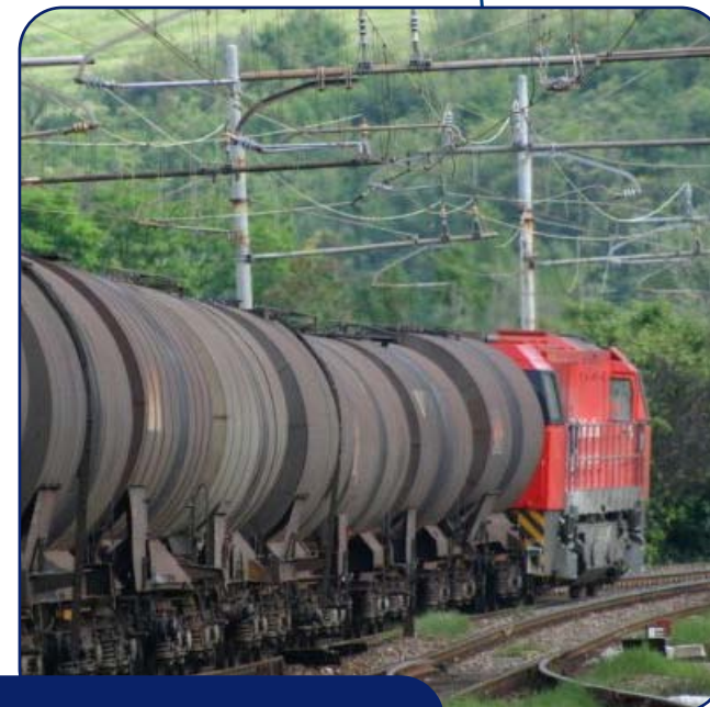
Gas e idrocarburi

Con quest'expertise può garantire ai propri clienti il meglio, qualunque siano le richieste.