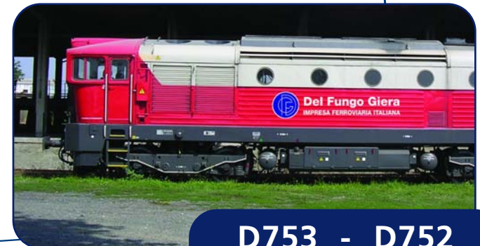
D753 - D752